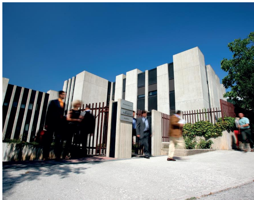
Figura 1 - Direzione Generale Colacem S.p.A. - Gubbio (PG)