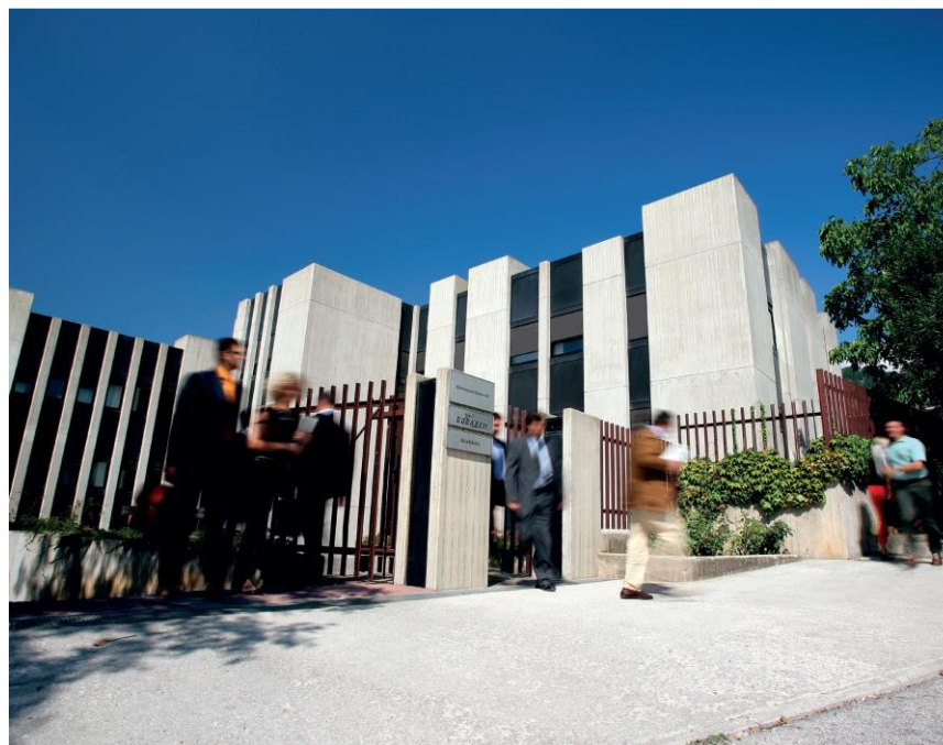
Figura 1 - Direzione Generale Colacem S.p.A. - Gubbio (PG)

Descrizione dell'organizzazione: Colacem S.p.A è una realtà industriale attiva nella produzione di cemento. L'azienda, creata dalla famiglia Colaiacovo nel 1966, si è sviluppata sullo slancio di una cultura d'impresa moderna e innovativa, fino ad attestarsi oggi in Italia, a terzo produttore 1 . La visione aziendale, improntata sulla sostenibilità, si fonda su un know-how organizzativo e tecnologico di rilievo. Colacem è certificata ISO 9001:2015. Colacem opera seguendo valori che pongono al centro la persona; per questo, lo sviluppo economico e le attività produttive vengono portate avanti di pari passo con il rispetto dell'ambiente e di chi vive nei territori, grazie a una corretta gestione delle risorse naturali, alla mitigazione degli impatti e ad un rapporto con le comunità locali attivo e responsabile. La società è presente in modo ramificato in Italia con vari stabilimenti a ciclo completo, terminal, depositi e uffici di area. La Direzione Generale è a Gubbio (PG). Gli impianti di Tunisi, Sabana Grande de Palenque (Repubblica Dominicana), Lafito (Haiti), Balldre (Albania), insieme ai terminal di Alicante, Cartagena (Spagna) e Kingston (Giamaica) rappresentano la realtà internazionale del Gruppo. In Italia Colacem occupa circa 900 dipendenti.