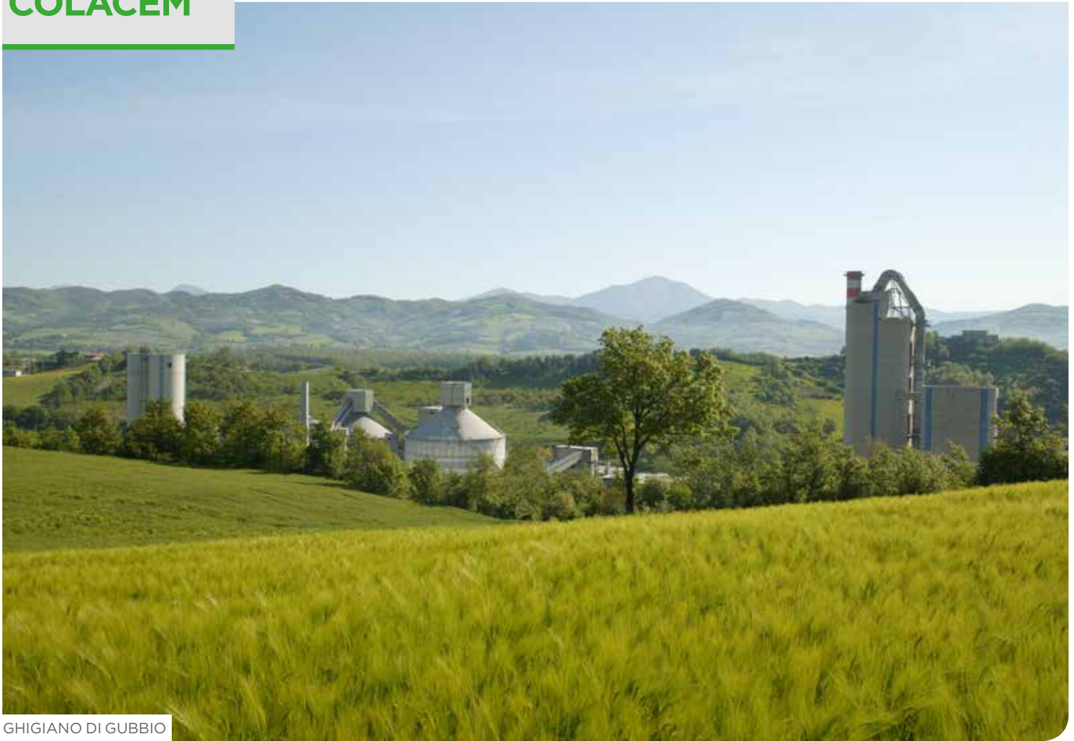
GHIGIANO DI GUBBIO

Colacem SpA è una realtà industriale attiva nella produzione di cemento dal 1966, con una visione aziendale da sempre orientata al mercato , all' innovazione tecnologica e alla sostenibilità .